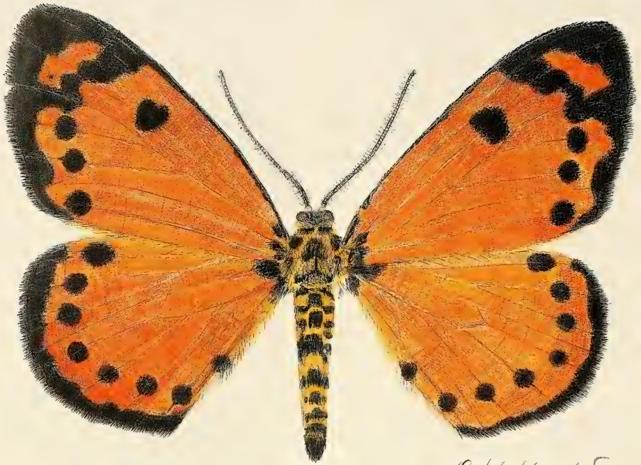
Abb. 1. Abraxas (Calospilos) breueri , spec. nov., Paratypus, ♂, Phil.[ippinen], Mindanao, Bukidnon, 45 km NW Maramag, Mt. Binanatiang, 1200 m, Bergregenwald, 2.x.1988, 7°55' N Breite, 124°40' E Länge, leg. Cerny & Schintlmeister, coll. Sommerer (R. Kühbandner pinxit).

Leach [1815] und Calospilos Hübner [1825], unterteilt. Die neu beschriebene Art gehört zur Untergattung Calospilos , die sich von der typischen Untergattung durch Färbung und Zeichnungsanlage, aber vor allem durch das Fehlen des Gnathos im männlichen Genital unterscheidet. Im indomalayischen und philippinischen Inselarchipel, wo ausschließlich Vertreter des Subgenus Calospilos vorkommen, haben eine Reihe von Arten eine rein schwarz-weiße Färbung entwickelt und sind tagaktiv geworden. Sie reihen sich dadurch in hervorragender Weise in einen umfangreichen Mimikry-Ring ein, zu dem weitere tagaktive, wie die Abraxas -Arten giftige oder ungenießbare Vertreter aus diversen Familien mit sehr ähnlichem Aussehen gehören. Zu nennen wären hier vor allem Arten der zu den Arctiidae gehörenden Nyctemerinae sowie die Gattung Corma Walker (Chalcosiinae, Zygaenidae). Auch etliche ungiftige Nachahmer, die oft ein verblüffend ähnliches Zeichnungsmuster tragen, profitieren von diesem Schutz.